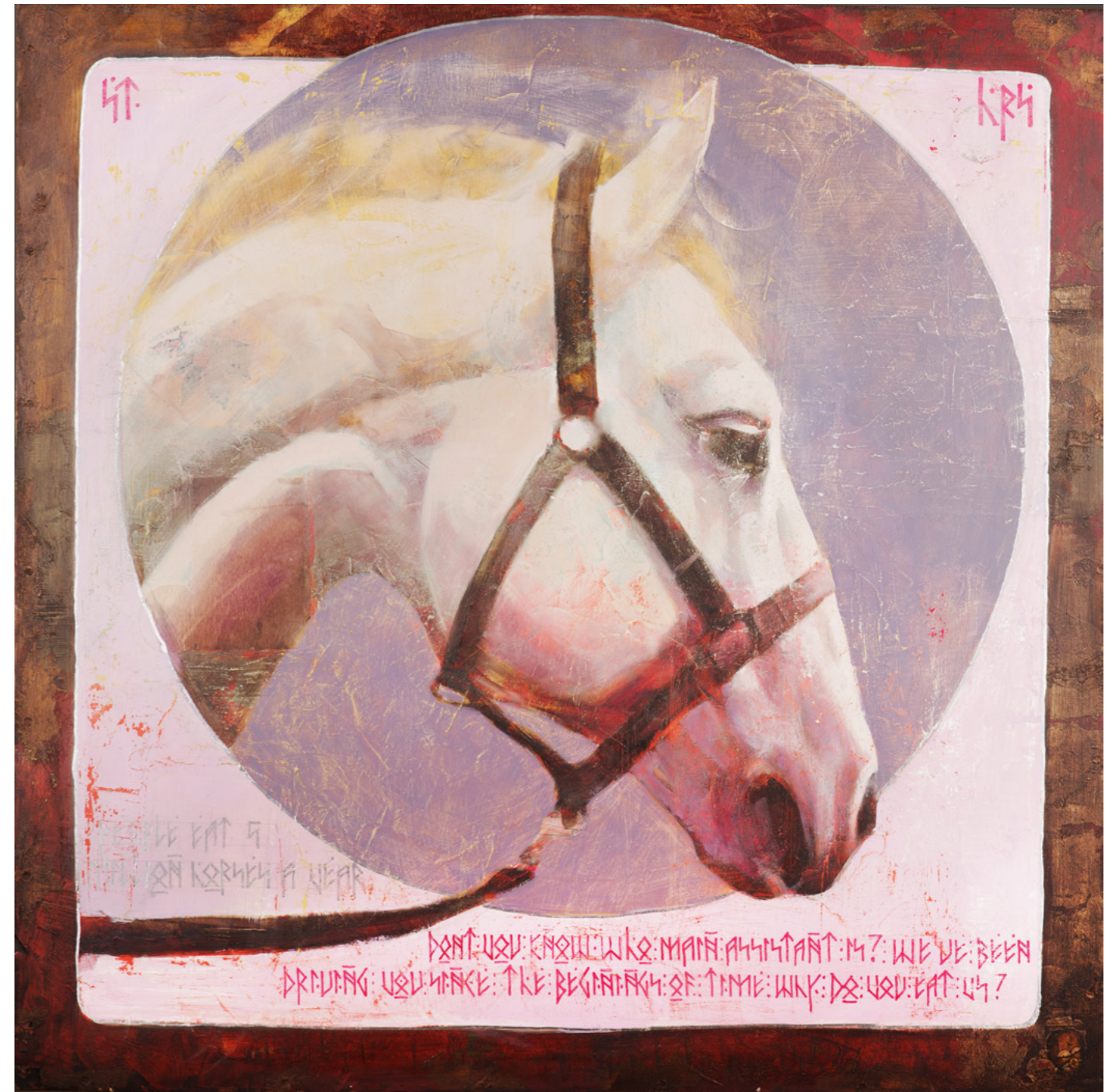
№ 10 2024 95 x 95 cm Oil on plywood | Olej na překližce