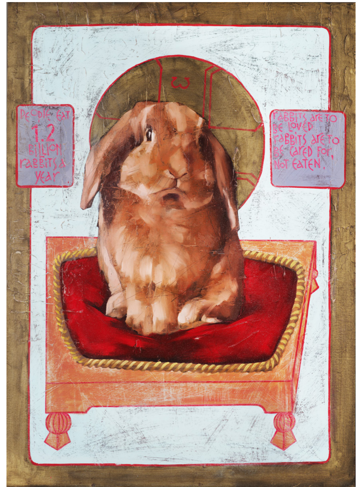
№ 3 2024 58 x 80 cm Oil on canvas | Olej na plátně