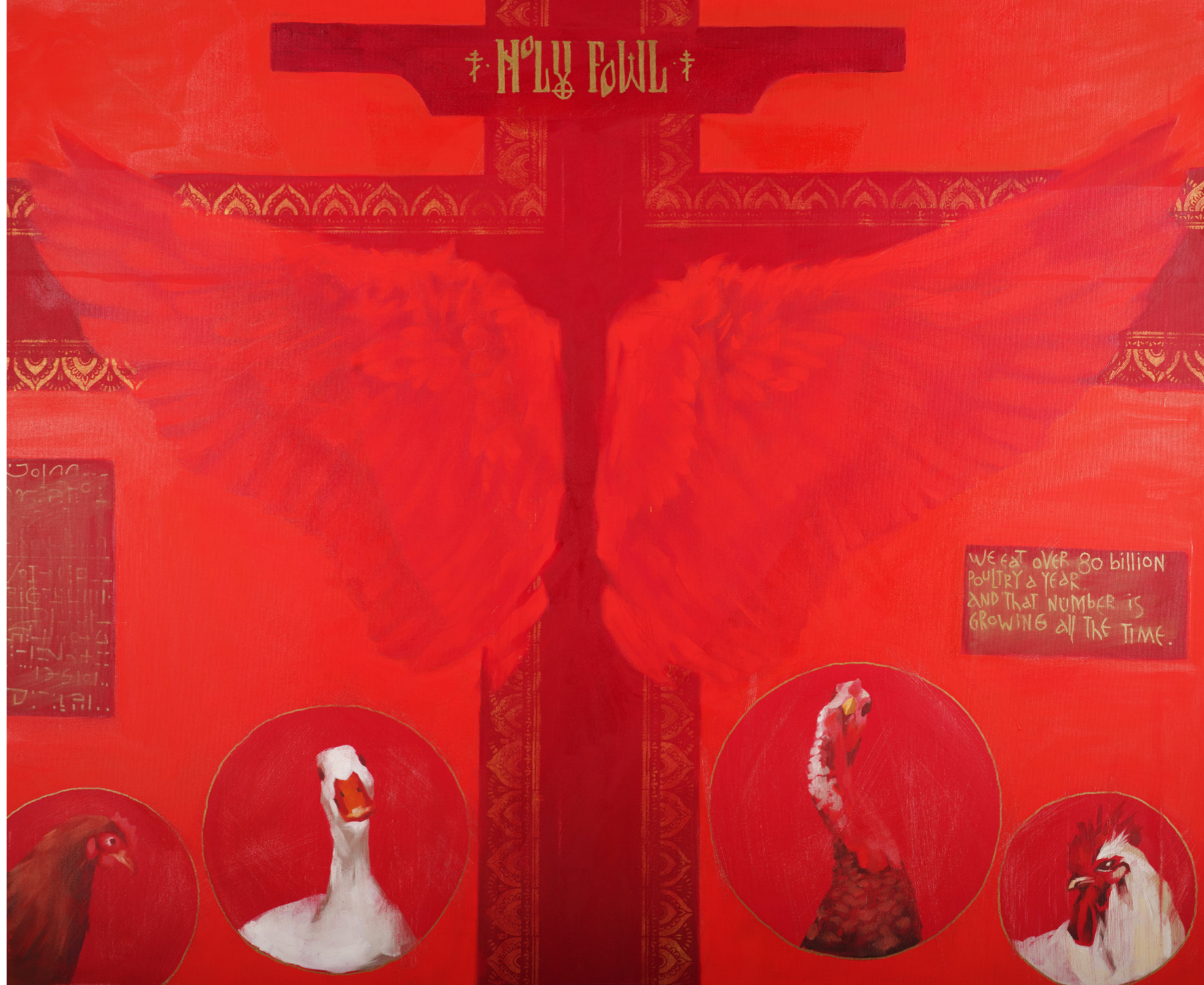
No 9 2024 120 x 100 cm Oil on canvas | Olej na plátně