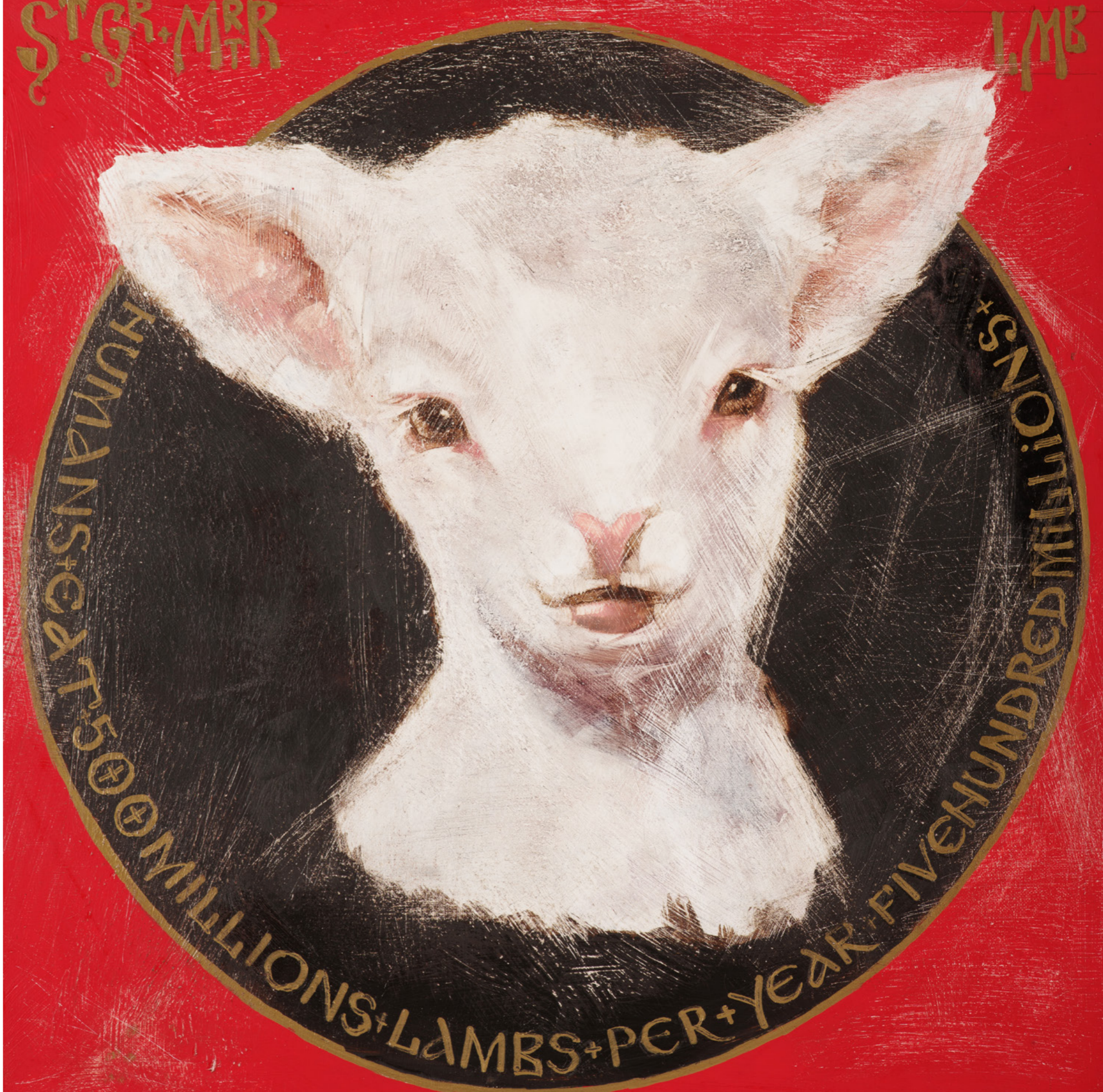
Nº 1 2024 40 x 40 cm Oil on canvas | Olej na plátně